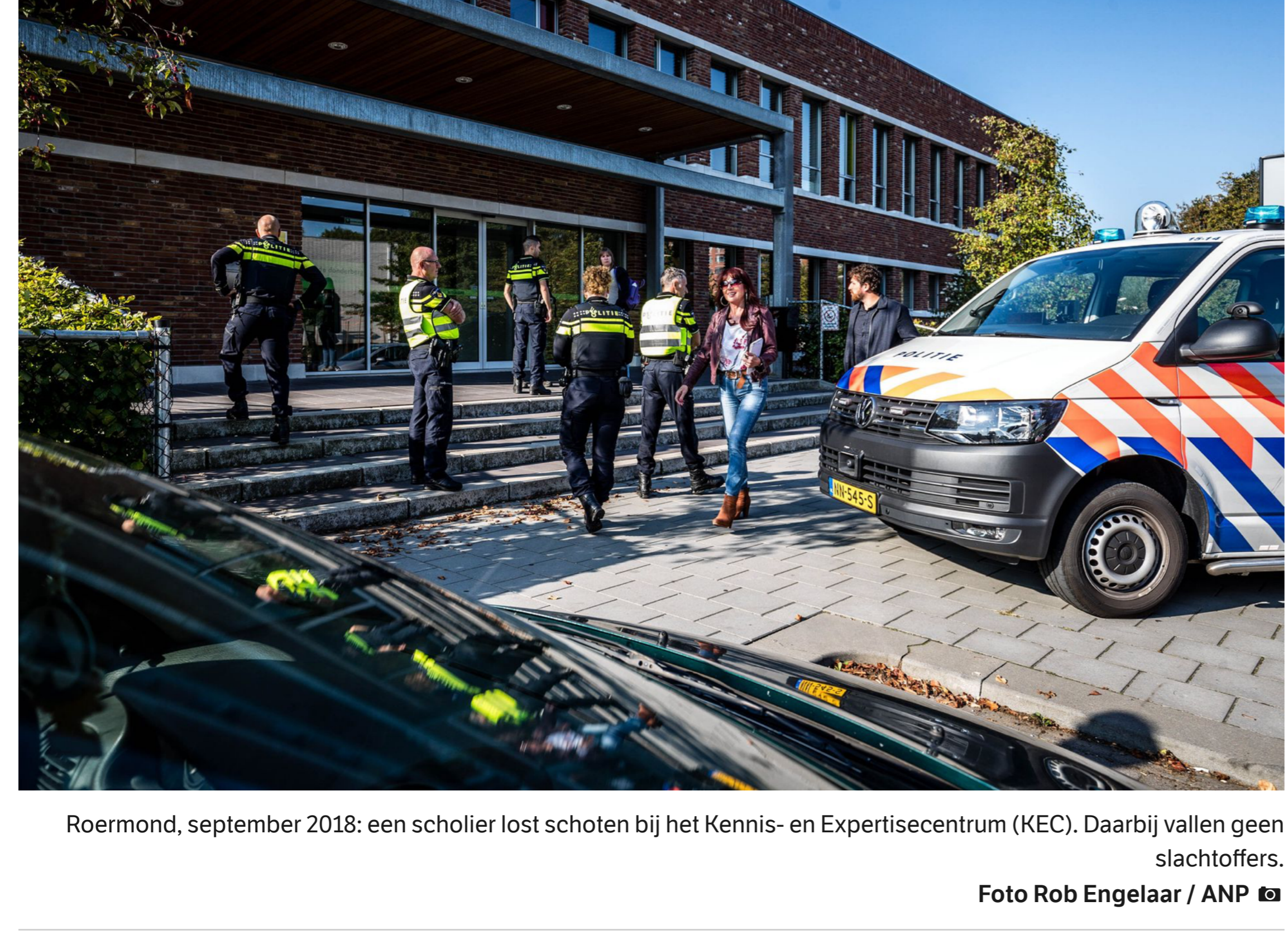
Roermond, september 2018: een scholier lost schoten bij het Kennis- en Expertisecentrum (KEC). Daarbij vallen geen slachtoffers.

Patricia Veldhuis 24 februari 2020 Leestijd 4 minuten