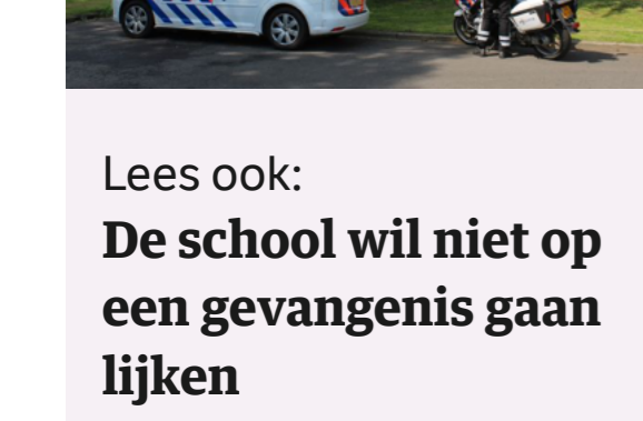
Lees ook: De school wil niet op een gevangenis gaan lijken

Leerlingen die betrap worden op dealen, worden van school gestuurd. Dat zijn „dramatische gesprekken”, zegt Van der Kruk. „Vaak hebben ze zelf niet in de gaten waar ze mee bezig waren. Ze dachten, ik haal gewoon wat extra drugs voor een vriendje. Maar dat is dus dealen.”