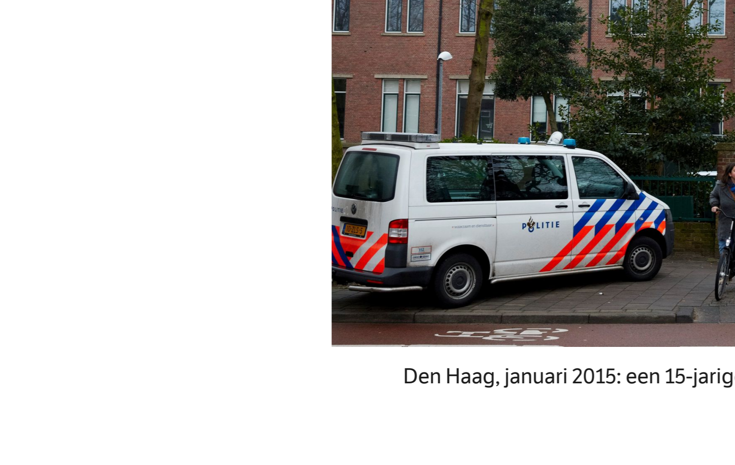
Den Haag, januari 2015: een 15-jarige jongen steekt op het Aloysius Collegegen schoolgenoot neer.